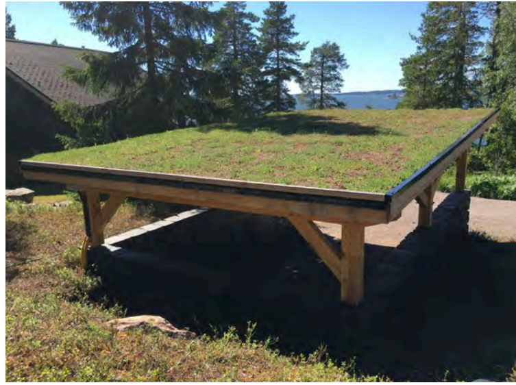
Kuvat: Byggcenter Forsström Oy ja MNY Arkitekter Ab